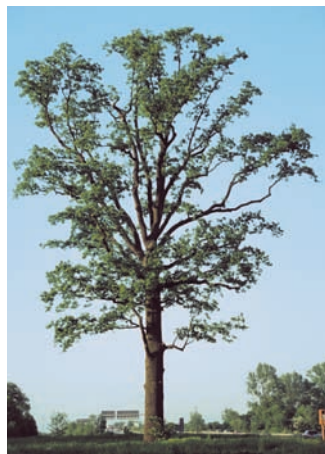
► Eiche vor und nach Kronenauslichtung und Kronenpflege